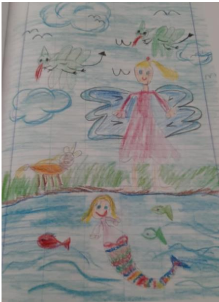
Il disegno di un alunno dell'IC di Tropea

con pennellate decise e con le tonalità più intense, un cammino policromo e pieno di entusiastica speranza.