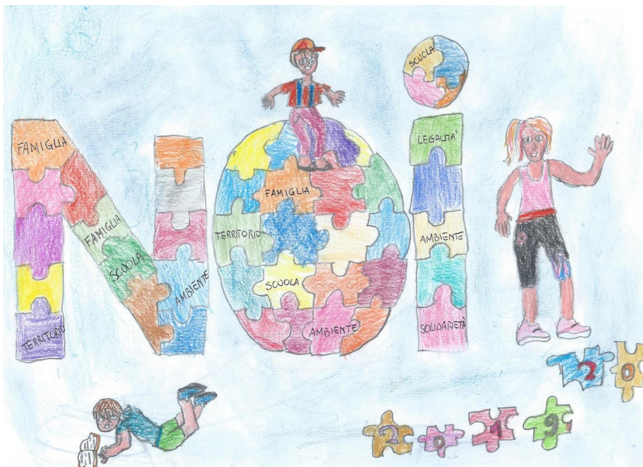
Foto dal we